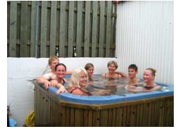
Hof Egilsstaðir 1 am Ufer der Þjórsá: Farmhaus, Ferienhaus Sjórnarhóll (4 Pers.), FH Innenansicht, Frühstücksbuffet, der Hot Pot