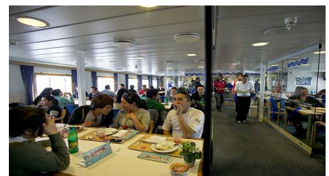
Restaurant an Bord der Sarfaq Ittuk