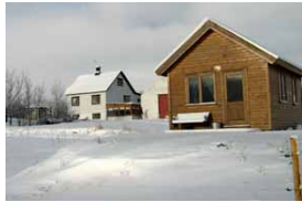
Ferienhaus Sjórnarhóll (4 Pers.), FH Innenansicht