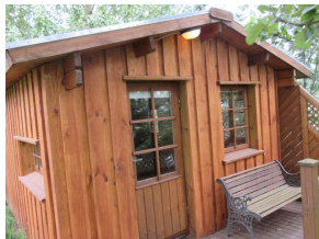
Ferienhaus Skógarkot (2 Personen), FH Innenansicht