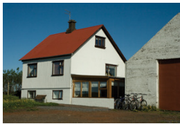
Hof Egilsstaðir 1